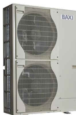
Udedel 11 & 16 kw