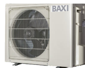
Udedel 6 KW